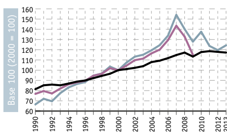
Fig. TRANS 2-3 Demande en transport de marchandises en Wallonie*